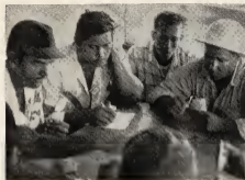
Algun di e obrerosan den welga, bregando carta den restaurant Barcadera.